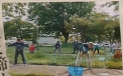
恒例の ラジオ体操