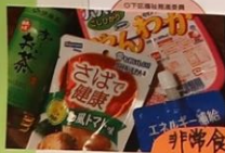
非常食にも なりとうはものと