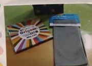
<8月> 初心者でもできるかな?