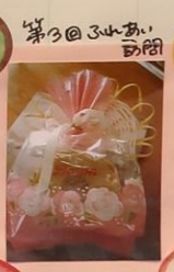
第3回ふれあい訪問

令和4年11月6日 中区福祉推進員 第2回ふれあい訪問のご案内 継続の考え込みが難しくなる、秋の深まりと今年はお別れが感じますが、皆様にはお変わりなく、ますますご健勝のこととお慶び申し上げます。 この度、下記記載のように第2回ふれあい訪問を行います。 記 日時 令和4年11月6日(日) 午前11時～午後1時 中区福祉推進員が各お宅にお伺い致します。 以上