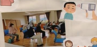
コロナ禍の中ご場々 ソーシャルディスタンスを守るの 体操