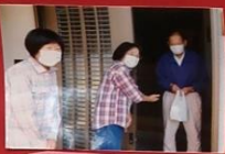
ありがとう。 が聞けたうれしい

コロナ感染の状況が少し 落ち着いた7月。久しぶりに 集まることができました。 会食は出来ないため、飲み 物やお菓子を準備して 簡単な体操やクイズなどで 楽しく過ごしました。