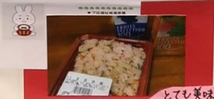
とても美味しい 五目赤飯

お家よりお話しをさせていただきます。 楽しいお話しの中でも小さな声でお話しを させていただきます。お話しをさせていただきます。