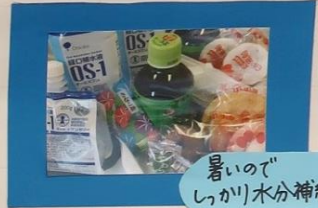
暑いので しゃがみ水分補給

コロナ感染の状況が少し 落ち着いた7月。久しぶりに 集まることができました。 会食は出来ないため、飲み 物やお菓子を準備して 簡単な体操やクイズなどで 楽しく過ごしました。