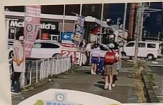
育成会のお手伝い (4回)